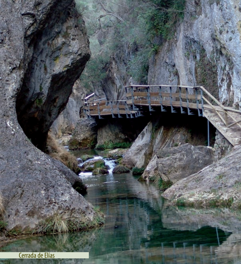
Cerrada de Elías