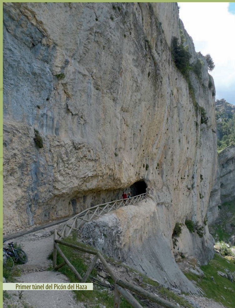
Primer túnel del Picón del Haza

A 1 km (aprox) de la presa de Aguas Negras (punto 5) se encuentra la Laguna de Valdeazores, dónde podremos ver nadando tranquilamente fochas, pollas de agua y ánades reales. Para volver al punto de inicio, sólo hay que deshacer el camino andado.